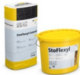
Maximaler Feuchteschutz bei minimaler Schichtdicke: bewährte Zwei-Komponenten-Lösung StoFlexyl und StoFlexyl Cement