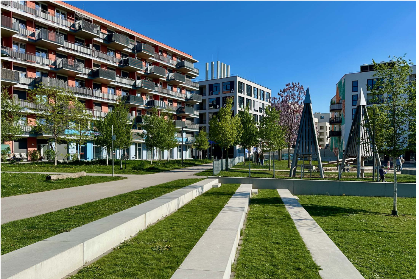
Seestadt Aspern

Wien | Programm 09. - 12.08.2026 | Climate Adaptive Design