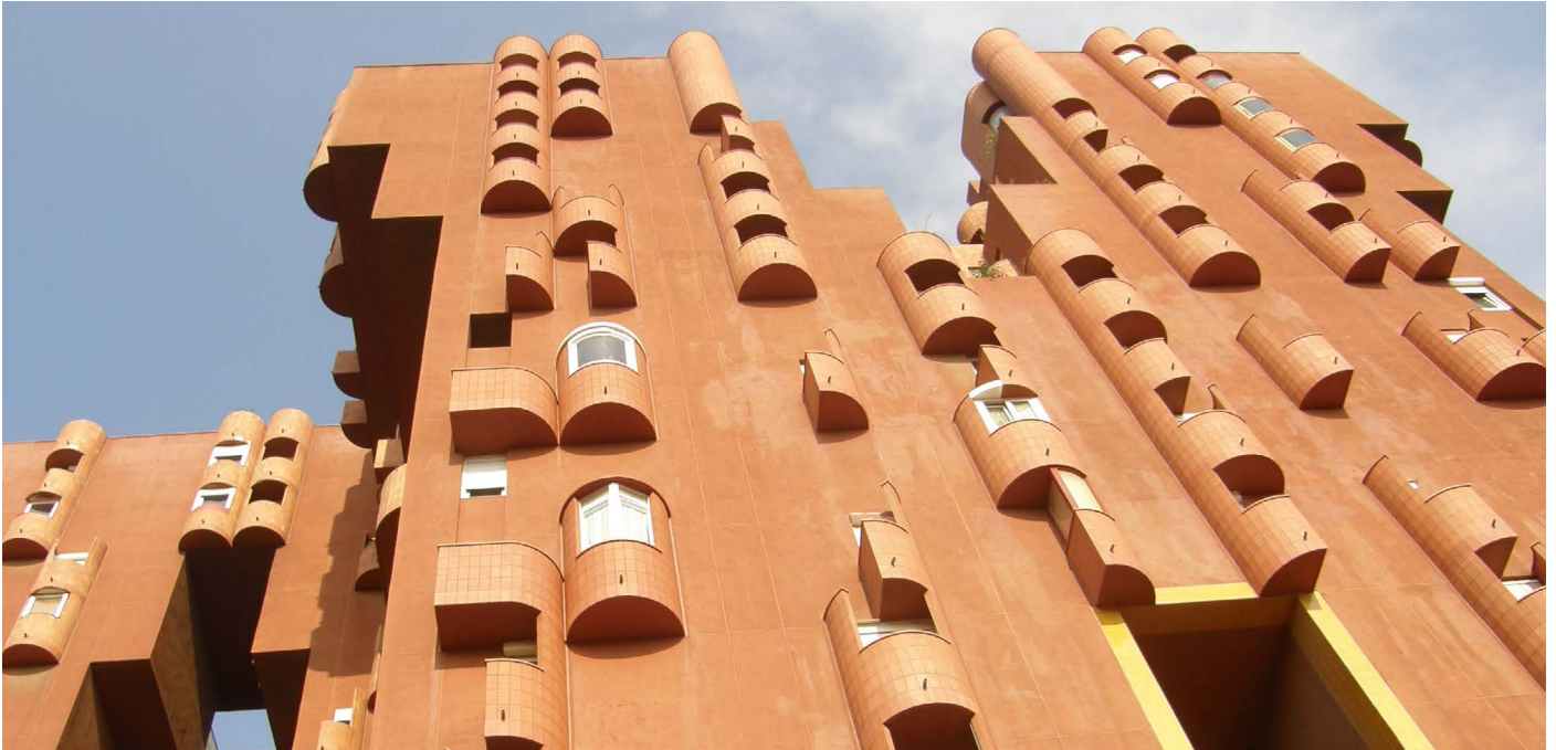
Walden 7 © StoForum Design