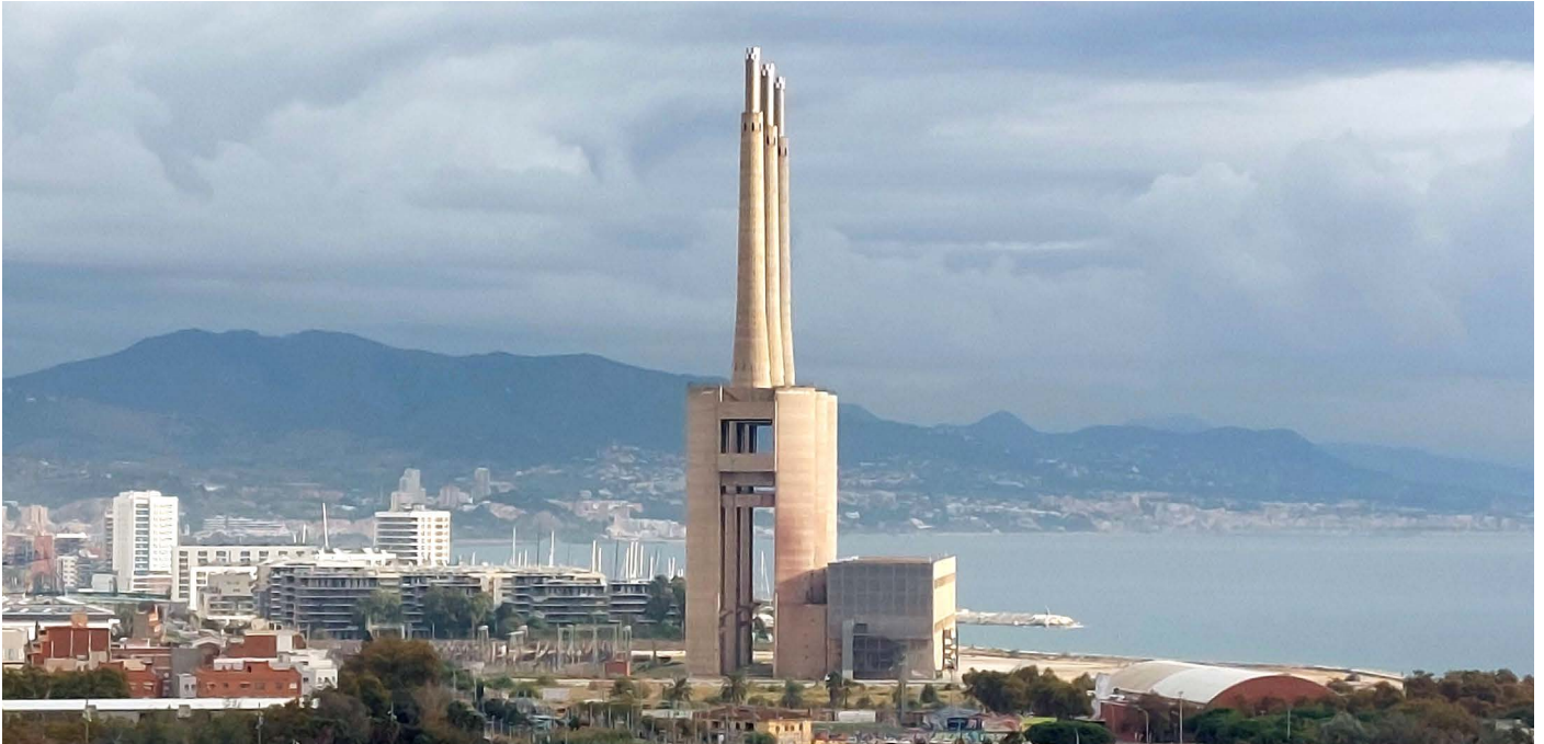
Tres Ximeneies

Noch vor wenigen Jahrzehnten lag Barcelona mit dem Rücken zum Wasser. Entlang der Küste errichtete Barackensiedlungen, Industrie- und Infrastrukturanlagen versperrten den Städtern Sicht und Zugang zum Mittelmeer. Vor allem im Zuge der Olympischen Spiele 1992 vollzieht sich Barcelonas Öffnung zum Meer. Der Bau des Olympischen Dorfes und des Olympiahafens, die Anlage eines attraktiven Stadtstrandes und der intelligente Umgang mit der Stadtautobahn trugen entscheidend zur Rückgewinnung des Küstenstreifens bei. Für den America's Cup 2024 erfahren der Port Vell und der Olympiahafen eine markante städtebauliche und architektonische Transformation