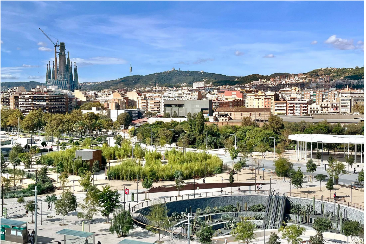
Plaça de les Glòries