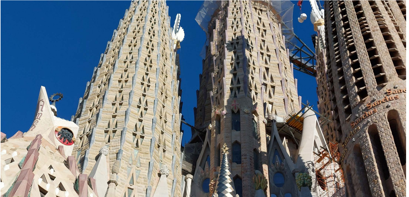
Sagrada Família © StoForum Design