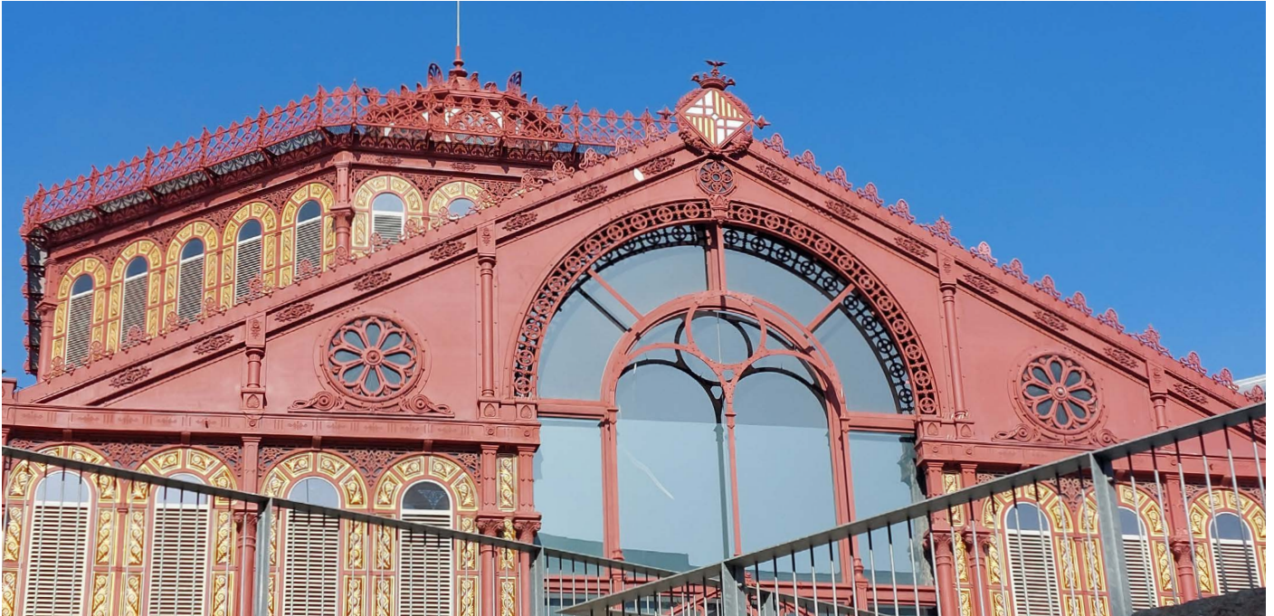
Mercat de Sant Antoni