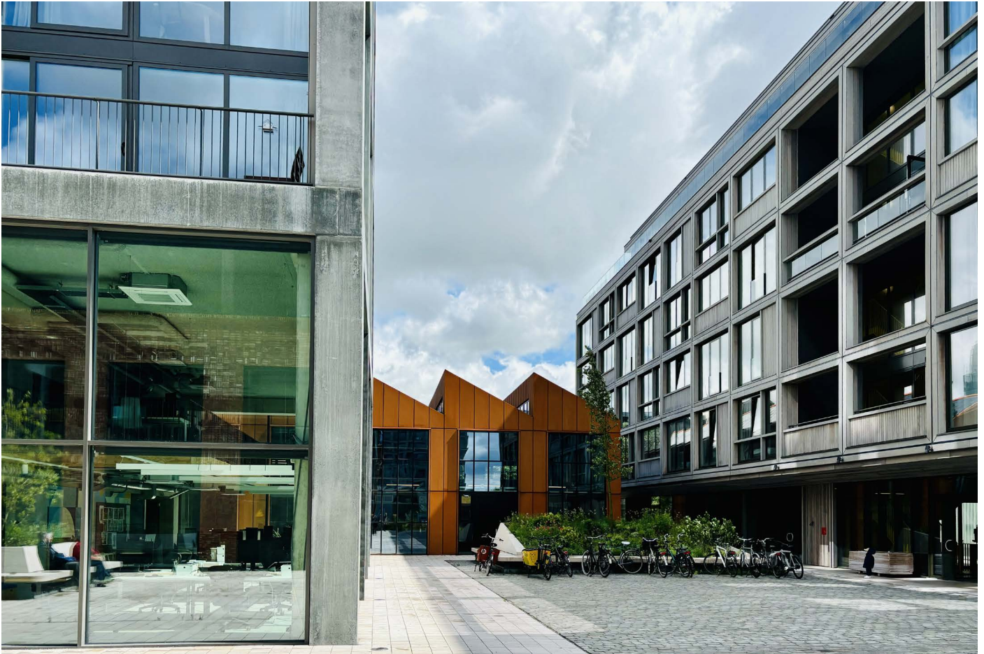
Republica, Amsterdam

Amsterdam | Rotterdam | Programm 21. - 24.06.2026 | Circular Construction